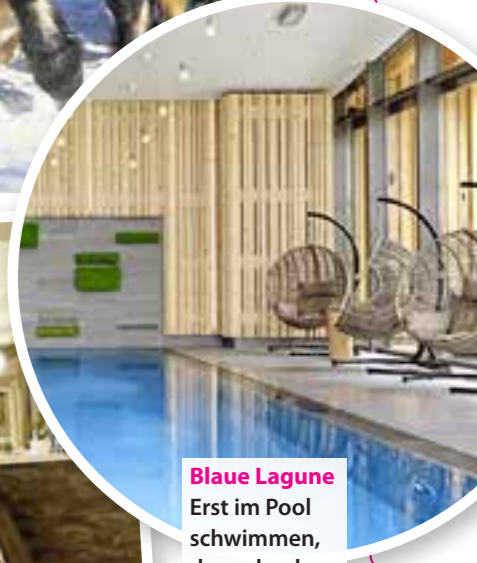
Blaue Lagune Erst im Pool schwimmen, dann durch den Schnee stapfen – tut das gut!