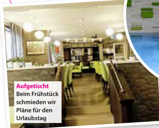
Aufgetischt Beim Frühstück schmieden wir Pläne für den Urlaubstag