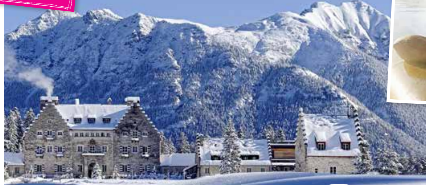
Postkartenidyll Majestätisch erhebt sich das Karwendelgebirge hinter der großzügigen Anlage