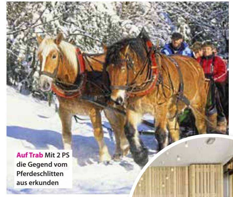
Auf Trab Mit 2 PS die Gegend vom Pferdeschlitten aus erkunden