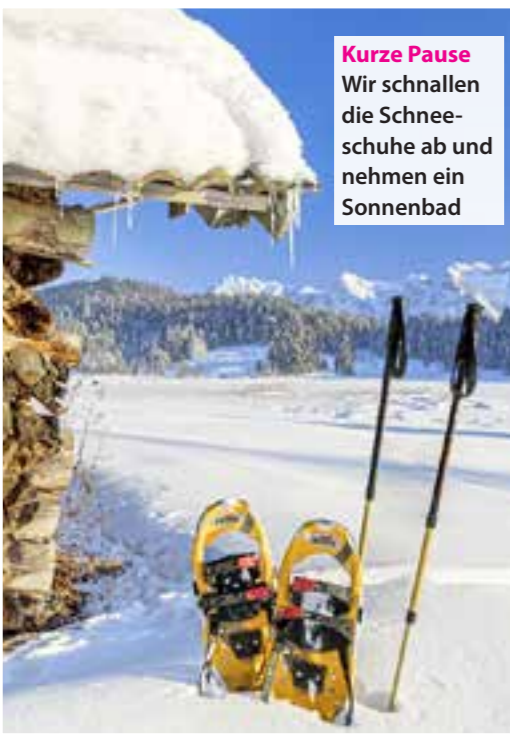
Kurze Pause Wir schnallen die Schneeschuhe ab und nehmen ein Sonnenbad