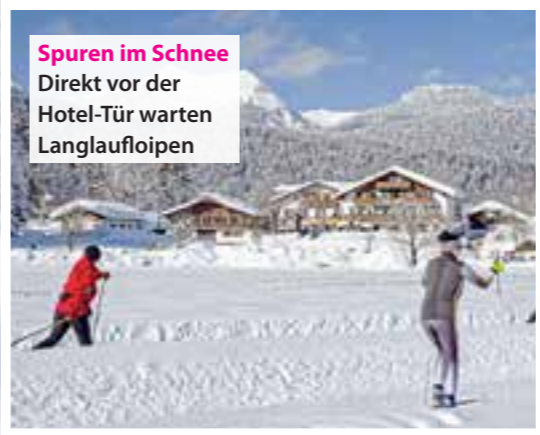
Spuren im Schnee Direkt vor der Hotel-Tür warten Langlaufloipen