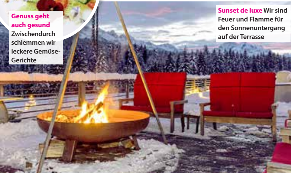
Sunset de luxe Wir sind Feuer und Flamme für den Sonnenuntergang auf der Terrasse

Umrahmt von mächtigen Bergen duckt sich das über 100 Jahre alte Schlösschen in glitzernde Schneewiesen. Wir fühlen uns wie in einem Märchenfilm und lassen uns königlich verwöhnen. Etwa bei einem Dampfbad in der „Ladies Sauna“ oder mit einer Zirben-Entspannungsmassage (50 Min. 81€) im Badehaus. Dann tanken wir Frischluft bei einer Schneeschuhwanderung (kostenloses Equipment vom Hotel). Das 4-Gang-Gourmet-Menü am Abend bringt wieder Power für morgen. Angebot „Kamingelüster“: 3 Ü/HP/1 Aromaöl-Massage etc. ab 687€ p.P. daskranzbach.de