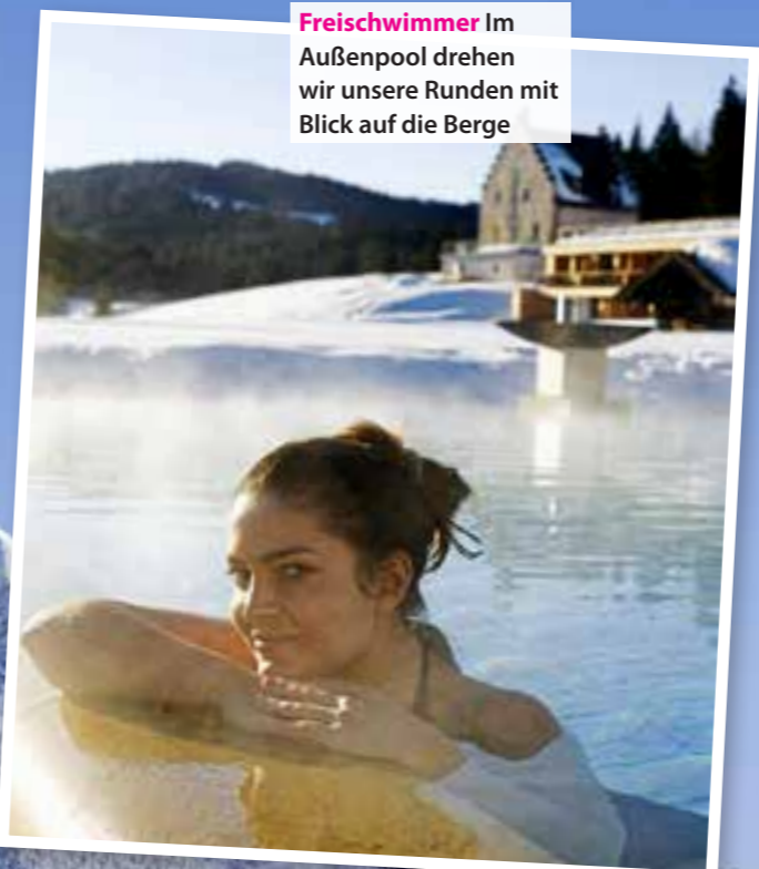
Freischwimmer Im Außenpool drehen wir unsere Runden mit Blick auf die Berge