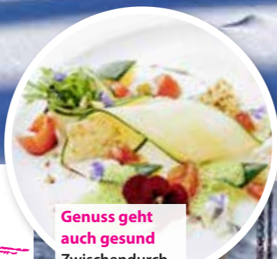
Genuss geht auch gesund Zwischendurch schlemmen wir leckere Gemüse-Gerichte