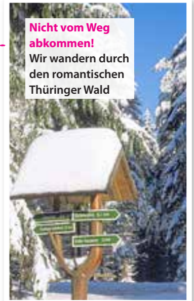
Nicht vom Weg abkommen! Wir wandern durch den romantischen Thüringer Wald

Wir residieren in einer historischen Villa aus dem 19. Jahrhundert im Herzen des beliebten Wintersportorts. Das Angebot ist riesig: Ganz in der Nähe locken Langlaufloipen, der Fallbachlift und eine Rennschlittenbahn. Wir gehen es heute ruhig an, spazieren staunend durch die verschneite Landschaft und entscheiden uns dann für eine beschauliche Pferdeschlittenfahrt (ab 23€ p.P., reitundkutsch.de ). Willkommen im Winter-Wunderland! DZ ab 119€. villa-silva-oberhof.de