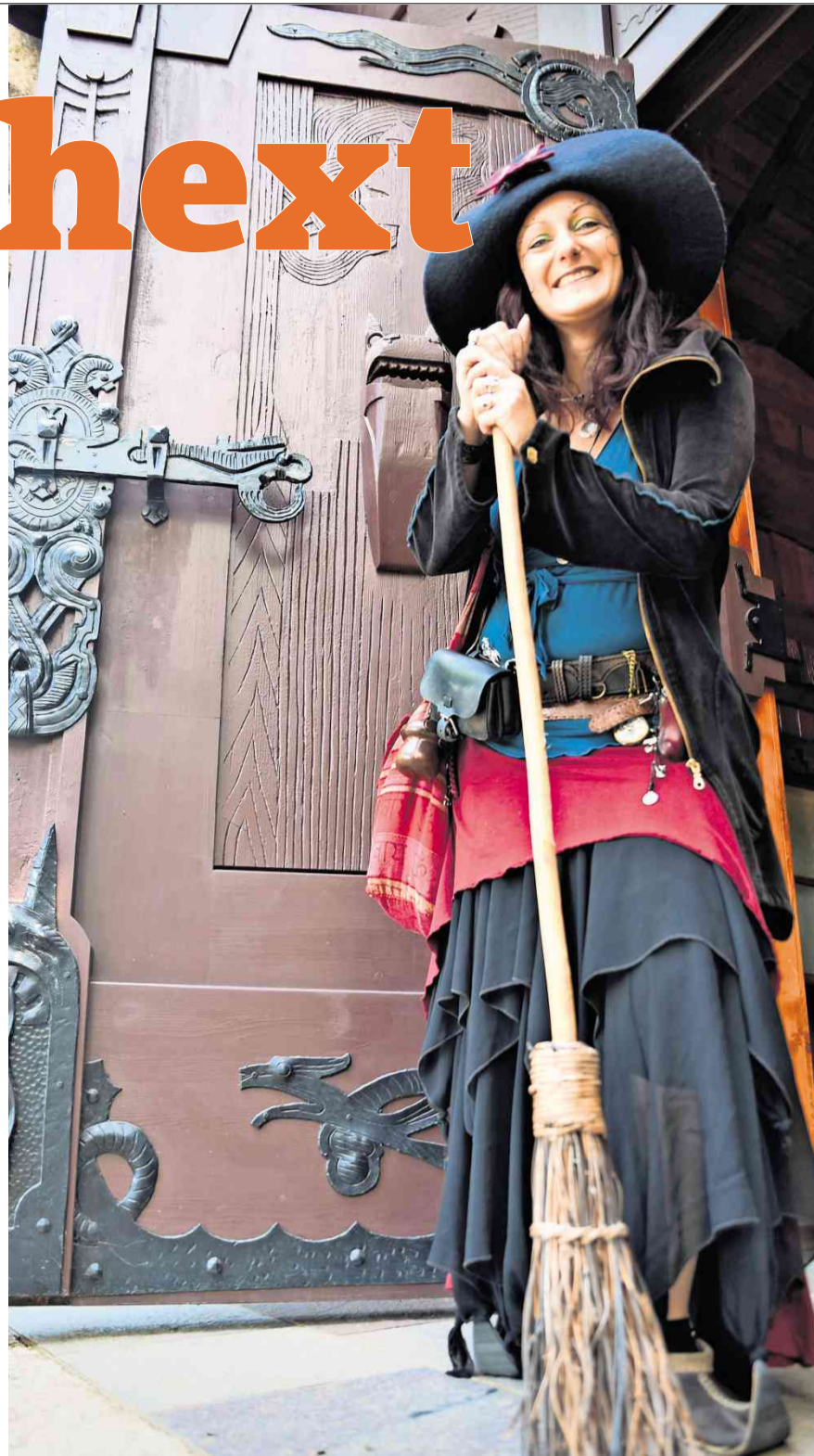
Hexe Naria freut sich auf baldigen Besuch in der Walpurgishalle.

Ein milder Wind weht durch den Harz. Auch rund um das Städtchen Thale ist die raue Bergwelt im Norden Mitteldeutschlands mit einem sanften grünen Schleier überzogen. Die Hexe Naria hat eigentlich schon Feierabend. Den Besen in der Hand steht sie am Eingang zur Walpurgishalle. Das mit nordischen Tier- und Götterdarstellungen verzierte Blockhaus erinnert an die Kulissen eines Wikingerfilms, Fantasy anno 1901. „Gerade wollte ich den Abflug machen“, sagt die hübsche Gästeführerin und lässt sich doch zu einem Foto überreden.